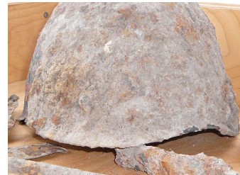
Каска советского воина, найденная в августе 2012г. на территории Сретенского храма

На линии железной дороги Малоярославец — Калуга немцы до последних дней пытались удержаться во что бы то ни стало. Железная дорога им нужна была не столько для перевозок, сколько как выгодная линия обороны. Однако закрепить здесь немцам не удалось. Отбив у них Калугу, а затем Малоярославец, наши части начали теснить врага с двух сторон. Они отвоёвывали у фашистов станцию за станцией, нанесли им чувствительные удары.