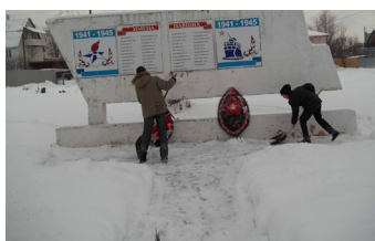
Расчистка дорожек зимой