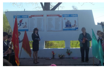
Классный час, посвященный Дню Победы