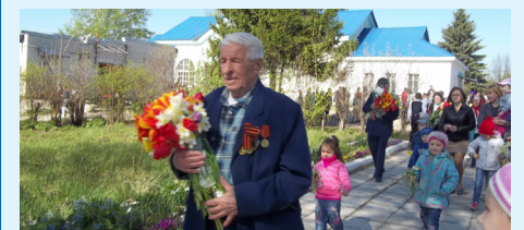
С Днем Победы, дорогие ветераны войн, труженики тыла, односельчане!

С тех пор установилась замечательная традиция каждый год 9 Мая силами школьников проводить митинг в честь Дня Победы. А 1 сентября и 25 мая к памятнику приходят первокурсники и выпускники, чтобы поклониться землякам-героям.