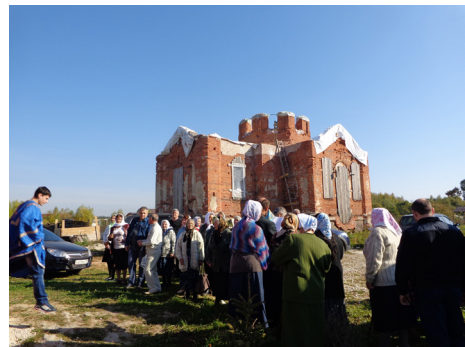
Вид Сретенского храма в 2014 году