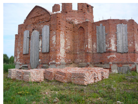
Запас кирпича для работ на храме в 2015 году

свода храма, восстановлен свод алтаря и частично подняты его стены. В 2015 г. планируется выложить барабан и свод храма, обустроить кровлю. На эти цели уже приобретено 34 куб.м. кирпича.