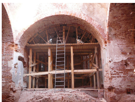
К 13 сентября практически закончена кладка свода алтарной части храма