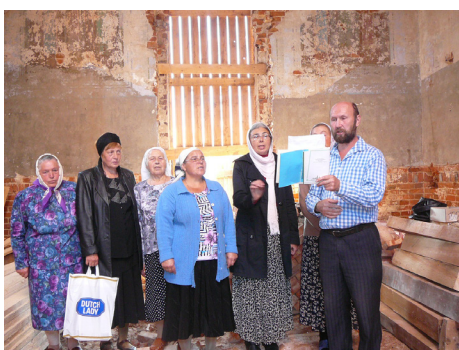
5 сентября 2014 года. В восстанавливаемом храме Сретения Господня впервые за многие годы прозвучали молитвы