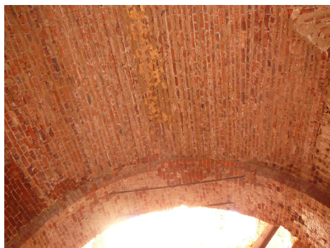
После снятия опалубки открылся свод в трапезной храма, выложенный осенью 2013 года