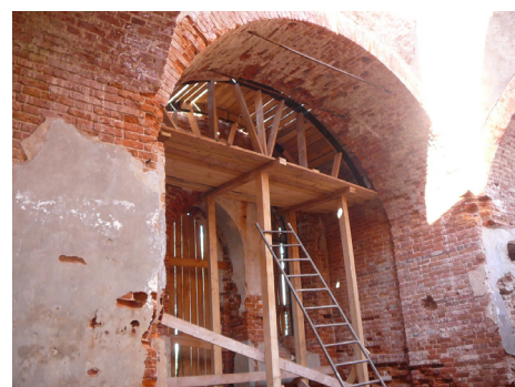
В первой декаде сентября 2014 года выложен свод северной части храма