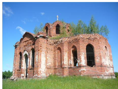
Вид Сретенского храма в 2006 году