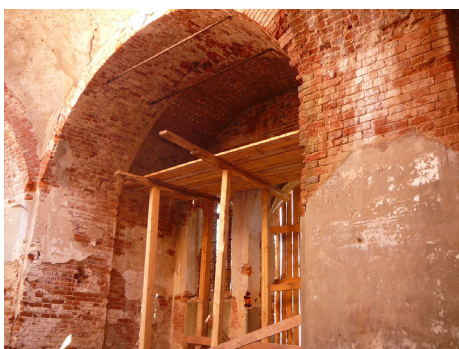
В конце августа 2014 года выложен свод южной части храма