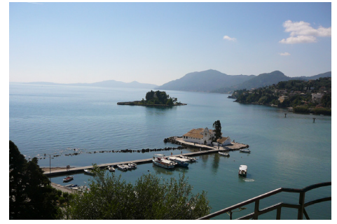
Островок с монастырем Влахерна (на переднем плане) и остров Понтикониси (Мышиный остров) с церковью Христа Пантократора

ли в храм. Мы мечтали причаститься — нам это удалось сделать. Мы многократно прикладывались к мощам святителя Спиридона. Приобрели и освятили большую икону для нашего храма. Видимо за многократное прочтение акафиста святителю удалось получить достаточно большое количество конвертиков с частичками его обуви, которых хватило всем присутствовавшим на первой после нашего возвращения с Корфу службе в нашем храме.