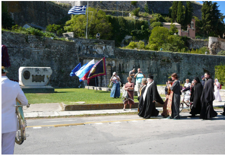
Памятник в честь великого русского флотоводца Федора Ушакова