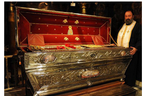
Рака с мощами святителя Спиридона

P.S. Чудеса продолжают и нет им преград по молитвенному обращению. Недавно наш зять попал в глупую аварию. Не буду вдаваться в подробности. Повреждения при аварии были самыми минимальными, однако виновная в аварии сторона не захотела решить вопрос миром. Даже потребовала компенсацию. Пришлось вызвать инспек-