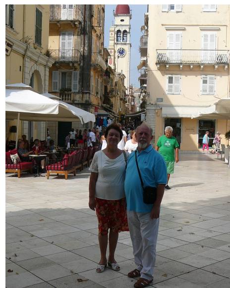
Вид на улицу Агиос Спиридонос и колокольню храма святителя Спиридона

Из полных десяти дней, которые мы были на Корфу, пять или шесть дней мы провели в Керкире, и каждый раз заходи-