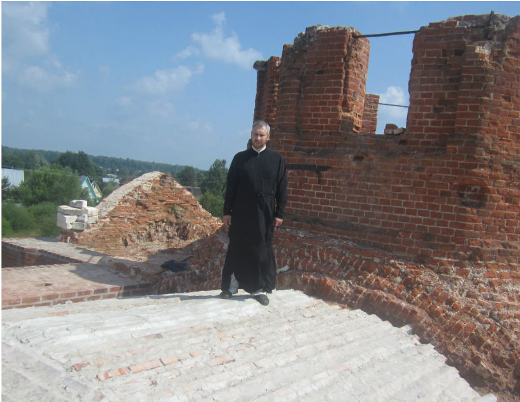
Важное событие в ходе восстановления Сретенского храма произошло начале августа 2013 г. восстановлено арочное перекрытие западной части Сретенского храма.