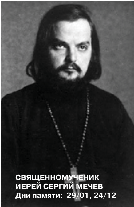
СВЯЩЕННОМУЧЕНИК ИЕРЕИ СЕРГИЙ МЕЧЕВ Дни памяти: 29/01, 24/12

Об этом очень хорошо сказал священномученик иерей Сергей Мечев