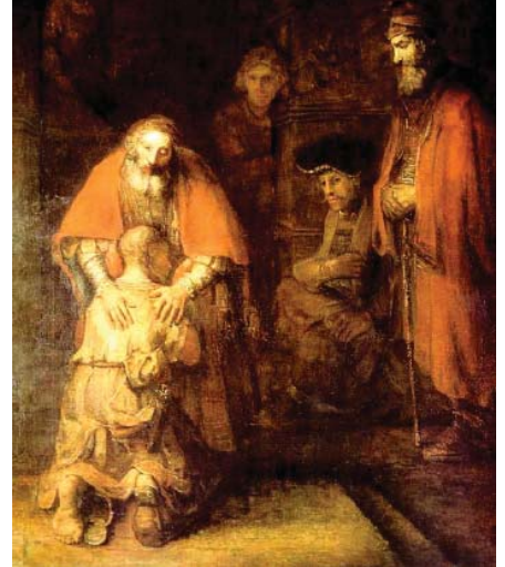
«Возвращение блудного сына» Рембрандт ван Рейн

Мы, блудные сыны, должны бы стремглав бежать к нашему Отцу Небесному, а кто не может бежать – не останавливаясь идти, ползти, цепляясь за каждую возможность преодолеть созданную нами пропасть на пути к Нему. Но мы придумываем разные предлоги, чтобы ублажить свое бренное тело: - «Я еще не готов»; - «Это не для меня»; - «У меня нет ни сил, ни времени на этот путь»; - «Я боюсь осуждения моего окружения»... Полюбите же в себе Образ Божий! Помилуйте же свою бессмертную душу!