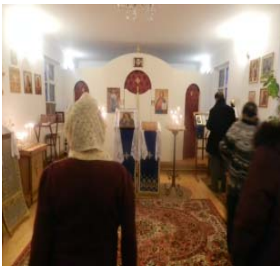
Несмотря на морозы, в нашем храме тепло, продолжают службы.