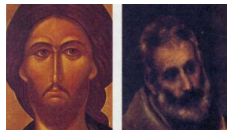
Лик на иконе (слева) и лицо на картине (справа)

Отсутствие внешнего источника света. Свет исходит от ликом и фигур, из глубины их, как символ святости. Есть прекрасное сравнение иконописи со светописью. Действительно, если внимательно поглядеть на икону древнего письма, то невозможно определить, где находится источник света, не видно, следовательно, и падающих от фигур теней. Икона – светоносна, и моделировка ликом происходит за счет света, изливающегося изнутри самих ликом. Технически это осуществляется особым способом письма, при котором белый грунтовый слой – левкас – просвечивает сквозь красочный слой. Подобная соотканность изображений из света заставляет нас обратиться к таким богословским понятиям, как исихазм и гуманизм, которые, в свою очередь, выросли из евангельского свидетельства о Преображении Господа нашего на горе Фавор.