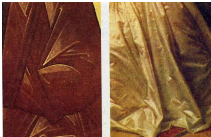
Пример изображения складок одежды на иконе (слева) и на картине (справа)

Другой пример: изображение гор на православных иконах. Это не синие рериховские вершины – на иконах это символы духовного восхождения, восхождения к личностному и Единому Богу. Поэтому горки на иконах имеют лещадки – своего рода стилизованные ступени, благодаря которым гора приобретает смысл лестницы.