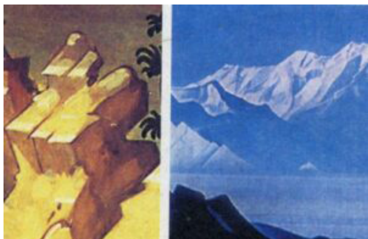
Горки на иконе (слева) и горы на картине (справа)