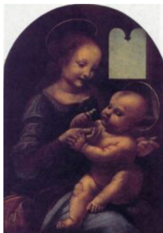
Картина Леонардо да Винчи «Мадонна Бенуа» («Мадонна с цветком»)