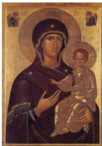
Икона Божьей Матери «Одигитрия»

Или можно проследить, как изображаются одежды на канонических иконах: вместо мягких и плавных линий складок ткани – жесткие, графичные изломы, которые по особому контрастируют с мягкой живописью ликов. Но линии складок не хаотичны, они подчинены общему композиционному ритму иконы. В таком подходе к изображению прослеживается идея освящения и человека, и физических предметов, окружающих его. По словам Леонида Александровича Успенского «свойством святости является то, что она освящает все то, что с ней соприкасается. Это есть начало грядущего преображения мира».