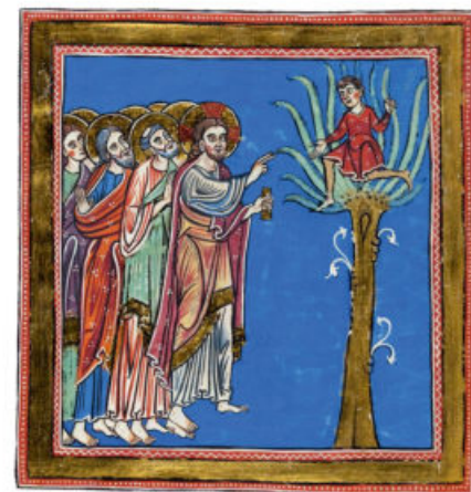
Дерево смоковницы, на котором сидит Закхей. Средневековая миниатюра

За лето только одна смоковница дает около тонны инжира. Основным урожаем она приносит