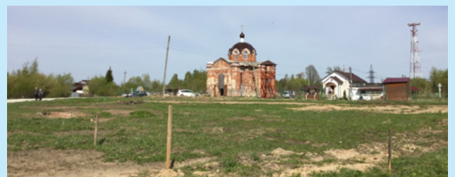
Вид Сретенского храма в мае 2017 г.