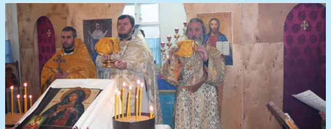
Ноябрь 2011 г. Первая литургия в новом храме.