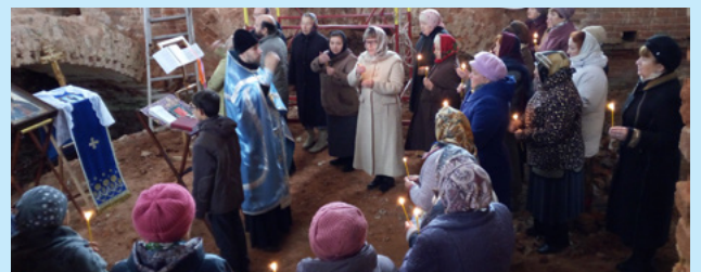
Октябрь 2016 г. Первый с 1918 г. молебен в Сретенском храме.