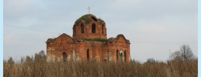
С чего мы начинали. Вид Сретенского храма в октябре 2006 г.