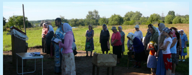
Май 2007 г. Первый молебен у стен Сретенского храма.