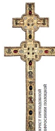
КРЕСТ ПРЕПОДОБНОЙ ЕФРОСИНИИ ПОЛОЦКОЙ

Чтобы исцелить повреждения, которые грех внес в природу человека, Господь в Своем воплощении принимает на Себя нашу природу, а вместе с ней и повреждения, которые в учении Церкви названы как страстность, тленность, смертность. Не имеющий никакого греха, Он принимает эти последствия греха добровольно, чтобы исцелить их в Себе. Но ценой такого исцеления была смерть. И на Кресте Господь заплатил ее за всех нас, чтобы потом силою Своего Божества воскреснуть и явить миру обновленную человеческую природу, уже не подверженную смерти, болезням и страданиям. Поэтому Крест является символом не только искупительной смерти Христа, но также — и Его славного Воскресения, открывшего путь в рай всем, кто готов следовать за Христом.