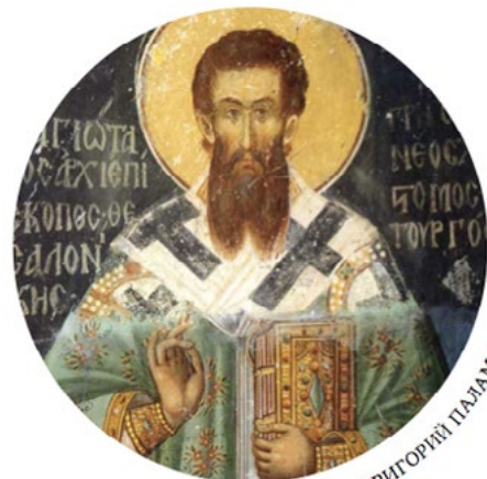
СВЯТИТЕЛЬ ГРИГОРИЙ ПАЛАМА

Учение святителя не было чем-то новым в Церкви. Догматически его учение является сходным с учением святого Симеона Нового Богослова о Божественном (Фаворском) свете и учением преподобного Максима Исповедника о двух волях во Христе. Однако именно Григорий Палама наиболее полно выразил церковное понимание этих важнейших для каждого христианина вопросов. Поэтому Церковь и чтит его память во вторую Неделю Великого поста