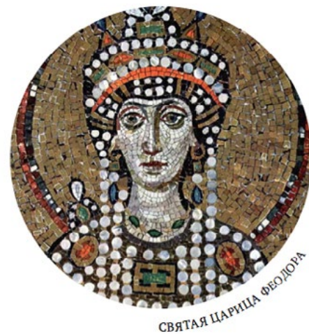
СВЯТАЯ ЦАРИЦА ФЕОДОРА

Борьба с иконопочитанием растянулась почти на столетие, и прекратилась лишь в 843 году, когда по инициативе императрицы Феодоры в Константинополе был созван собор, на котором было решено восстановить почитание икон в Церкви. После того как собор осудил еретиков-иконоборцев, Феодора устроила церковное торжество, которое пришлось на первое воскресенье Великого поста. В воспоминание об этом событии ежегодно в первое воскресенье Великого поста Православная Церковь торжественно празднует восстановление иконопочитания, именуемое Торжеством Православия