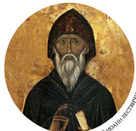
ПРЕПОДОБНЫЙ ИОАНН ЛЕСТВИЧНИК

В 75-летнем возрасте Иоанн против своего желания был возведен в должность начальника Синайской обители. Монастырем он управлял недолго, всего четыре года. Но именно в это время им была написана удивительная книга — «Лествица». История ее создания такова. Однажды иноки монастыря, расположенного в двух днях пути от Синая, прислали Иоанну письмо с просьбой составить для них руководство в духовно-нравственной жизни. В письме они называли такое руководство надежной лестницей, по которой им можно было бы безопасно восходить от земной жизни к Небесным вратам (духовному совершенству). Иоанну понравился этот образ. Откликнувшись на просьбу собратьев, он написал книгу, которую так и назвал — Лествица. И хотя книга эта появилась 13